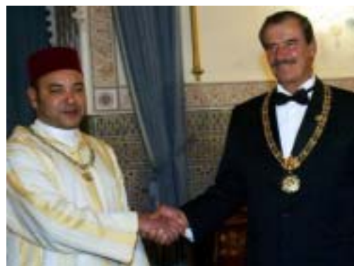
SM el Rey y el Presidente Fox

Gracias a la visita de Estado del Presidente Vicente Fox a Marrakech, se abrió una página nueva en las relaciones bilaterales entre Marruecos y México. La visita del Jefe de Estado mexicano a nuestro país se inscribe en el marco de la dinámica emprendida por la visita de Su Majestad el Rey Mohammed VI a México, en noviembre del año pasado, en el marco de una gira por América Latina. Esta visita tiende a favorecer este impulso de dinamismo que caracteriza las relaciones entre Rabat y México. La visita estuvo marcada por la firma de nuevos acuerdos que vienen a consolidar el marco jurídico y conferir a las relaciones bilaterales los medios más apropiados para la promoción de la cooperación bilateral en los dominios de las reservas hidráulicas y a la formación diplomática. Las visitas de los respectivos Jefes de Estado así como los esfuerzos desplegados por ambos, contribuyeron a asentar un diálogo político sobre las relaciones bilaterales, los medios para afirmarlas y sobre las cuestiones de la agenda internacional. La concordancia que ha caracterizado las posiciones expresadas sobre los diferentes temas abordados vino efectivamente a confortar este alto nivel de diálogo político, dotado a partir de ahora de mecanismos para procurarle una cierta regularidad. En el marco de este diálogo político, el Jefe de Estado mexicano reiteró la posición de su país a favor de una solución política negociada de la cuestión del Sahara, dentro del marco de las Naciones Unidas.