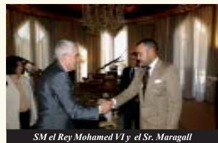
SM el Rey Mohamed VI y el Sr. Maragall