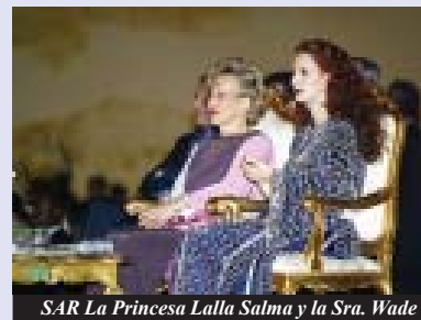
SAR La Princesa Lalla Salma y la Sra. Wade