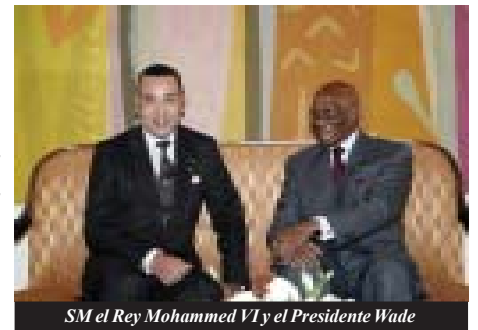
SM el Rey Mohammed VI y el Presidente Wade