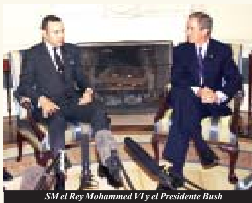
SM el Rey Mohammed VI y el Presidente Bush

El Presidente norteamericano, Sr. George W. Bush otorgó, el 03 de junio pasado, a Marruecos el estatuto de “aliado mayor fuera de la OTAN” de Estados Unidos. Esta medida presidencial fue tomada conforme a las disposiciones de legislación relativa a la ayuda financiera y a la venta de equipamientos militar por Estados Unidos. “El Presidente ha tomado