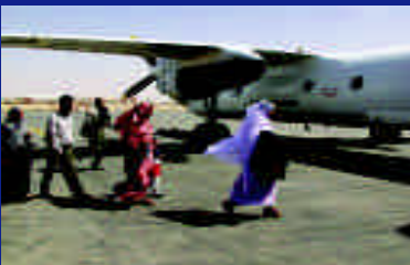
Marruecos adoptó una visión humanitaria para romper el aislamiento de sus ciudadanos secuestrados en Tinduf