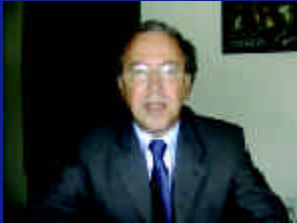
La solución del Sahara marroquí es política y debe ser aceptada por las partes