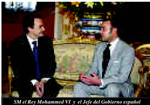
SM el Rey Mohammed VI y el Jefe del Gobierno español

E l nuevo Presidente del Gobierno español, Sr. José Luis Rodríguez Zapatero efectuó, el sábado 24 de abril una visita oficial a Marruecos, la primera al extranjero a raíz de su investidura oficial, el 16 de abril del 2004. Durante esta visita, Sr. Zapatero fue recibido en audiencia por SM. El Rey Mohammed VI. El Soberano y el Presidente del Gobierno español procedieron a la inauguración de una placa conmemorativa, en la plaza Mohammed V, en Casablanca, en memoria de las víctimas de los atentados terroristas del 16 de mayo del 2003, con la presencia de los Embajadores de Francia, Italia, el Ministro marroquí de Habus y de Asuntos Islámicos, el Gran Rabino de Casablanca así como el Encargado de la Iglesia Notre-Dame.