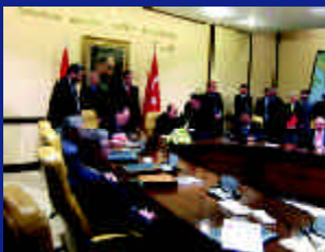
Acuerdo de Libre Comercio con Turquía