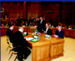
"Acuerdo de Agadir"