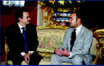
Rabat y Madrid inauguran nueva era de entendimiento y de cooperación