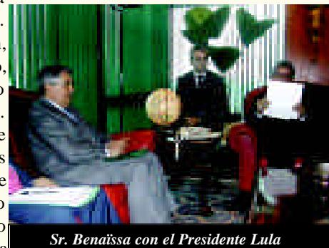
Sr. Benaïssa con el Presidente Lula

países del sur del Mediterráneo. Durante esta visita de trabajo, efectuada por invitación del Sr. Celso Amorim, el Ministro de Asuntos Exteriores y de la Cooperación, en su calidad de Emisario Especial de SM el Rey, ha sido recibido por el Presidente Lula Da Silva, a quien le ha entregado un mensaje del Soberano. En ocasión de su estancia en Brasilia, Sr. Benaïssa se entrevistó, igualmente, con el Sr. Joao Paulo Cunha, Presidente de la cámara de diputados, Sr. Luiz Fernando Furlan, Ministro de Desarrollo, Industria y de Comercio Exterior y con el Sr. Gilberto Gil, Ministro de Cultura. Estos encuentros, que se inscriben en el marco del continuo dialogo bilateral, “ayudarán a