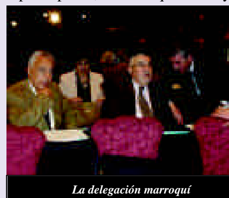
La delegación marroquí

Por otra parte, “para los gobiernos como para los parlamentarios, la esta-