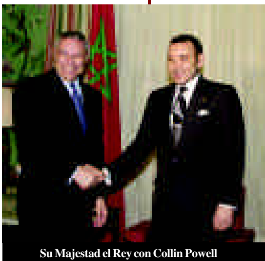
Su Majestad el Rey con Collin Powell

conclusión de las negociaciones durante el 2003. Cabe destacar que el grupo de negociación marroquí del Acuerdo de Libre Comercio entre el Reino de Marruecos y los Estados Unidos de América ya celebró en diciembre del 2002 su reunión en Rabat donde se puso énfasis sobre la importancia que reviste para Marruecos la conclusión de un TLC con EEUU. Este instrumento que dará lugar, sin duda alguna, a un impulso a las relaciones entre EEUU y Marruecos. Doce grupos de negociación han sido constituidos por la parte marroquí y abarcan sectores importantes para potenciar la cooperación entre EEUU y Marruecos. Participan en estos grupos de negociación además de importantes responsables de la administración marroquí representantes del sector privado y empresarial. ●