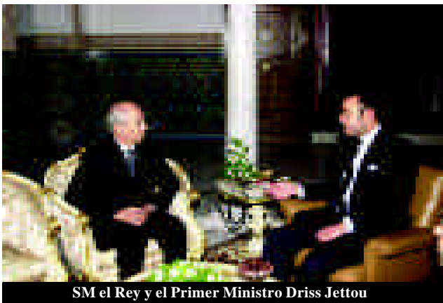
SM el Rey y el Primer Ministro Driss Jettou

Jettou: Es verdad que el PJD logró un avance significativo, pero sólo obtuvo algo más del 13% de los sufragios y 42 escaños sobre un total de 325 en la Cámara de Representantes. Esta pregunta está demasiado marcada por el síndrome de lo que ha pasado en Argelia en la última década. Pero, créame, ni Marruecos, plenamente sereno sobre la evolución de su democracia, ni sus socios europeos, deben estar inquietos. Yo diría más bien todo lo contrario: Lo sucedido es un síntoma de buena salud democrática.