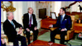
SM el Rey Mohammed VI y James Baker