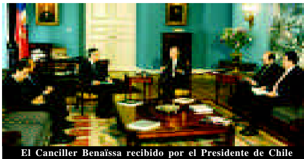
El Canciller Benaïssa recibido por el Presidente de Chile

La gira que acaba de realizar el Canciller Mohamed Benaïssa en cuatro países de América Latina demuestra de manera tajante la voluntad del país de profundizar y consolidar las relaciones de amistad, y de diversificar sus socios económicos y comerciales. Esta gira del Canciller Benaïssa en el Continente Latinoamericano, la cuarta desde la entronización de S.M Mohammed VI, traduce además la voluntad firme de Marruecos de abrir nuevos horizontes de cooperación y promover con