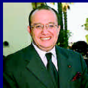
Acuerdo de Libre Comercio entre EEUU y Marruecos