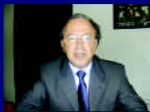
Calvario de los Marroquíes detenidos en Tinduf