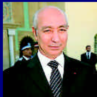
Primer Ministro Driss Jettou en el diario El País