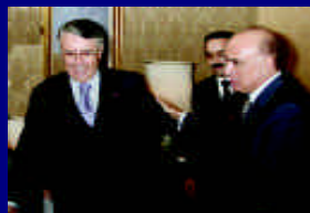
El Canciller Benaïssa en Gira por América Latina