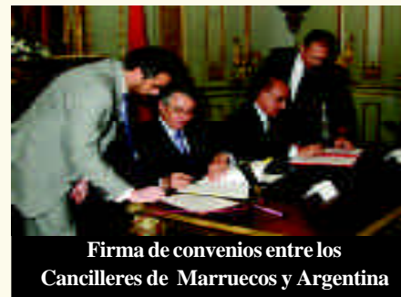
Firma de convenios entre los Cancilleres de Marruecos y Argentina