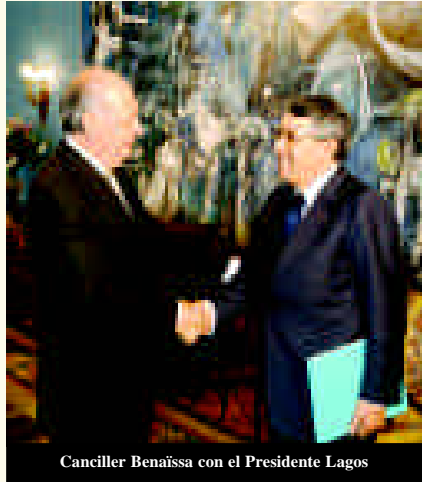
Canciller Benaïssa con el Presidente Lagos

El Presidente Lagos examinó, por otra parte, con Benaïssa el estado de las relaciones bilaterales y los medios para desarrollarlas más. Durante su estancia en Chile, el Jefe de la Diplomacia marroquí se entrevistó con el Señor José Miguel Insulza, Vice Presidente