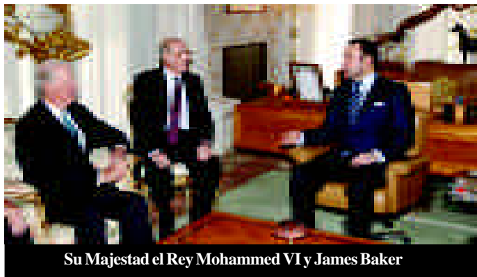
Su Majestad el Rey Mohammed VI y James Baker

James Baker, el representante para el Sahara del Secretario General de la ONU Kofi Annan efectuó una gira por el Maghreb durante la cual entregó a los mandatarios de la región un nuevo plan para resolver el conflicto del Sahara. Durante su estancia en Marruecos, el Señor James Baker portador de una iniciativa para encontrar una solución política a la cuestión del Sahara ha sido recibido por Su Majestad Mohammed VI en la ciudad de Agadir.