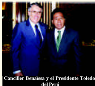
Canciller Benaïssa y el Presidente Toledo del Perú